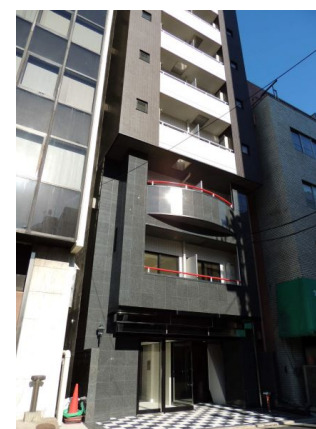
プチグランデ秋葉原外観

※図面と現況が異なる場合は現況を優先とします。 ※インターネット・有料チャンネルのご利用には、別途各会社との契約が必要です。 ※個人契約の際は家賃保証会社のご契約が必要となります。