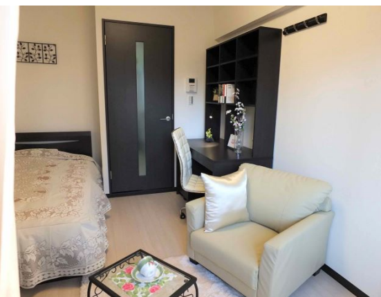
プチグランデ秋葉原室内イメージ