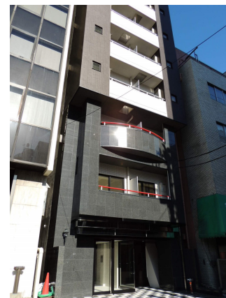
プチグランデ秋葉原

※図面と現況が異なる場合は現況を優先とします。 ※インターネット・有料チャンネルのご利用には、別途各会社との契約が必要です。 ※個人契約の際は家賃保証会社のご契約が必要となります。