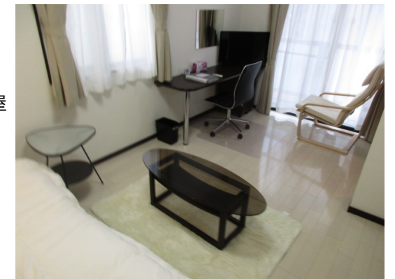
プチグランデパティオ 室内