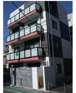
プチグランデパティオ 外観