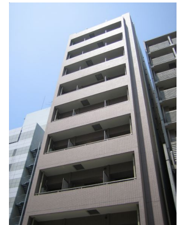
プチグランデミレーヌ 外観