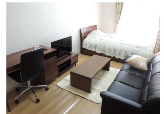
プチグランデミレーヌ 室内イメージ

※図面と現況が異なる場合は現況を優先とします。 ※写真の製品とは異なる場合があります。 ※インターネット・有料チャンネルのご利用には、別途各会社との契約が必要です。 ※個人契約の際は家賃保証会社のご契約が必要となります。