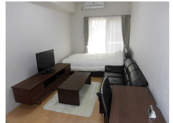
プチグランデミレーヌ 室内イメージ