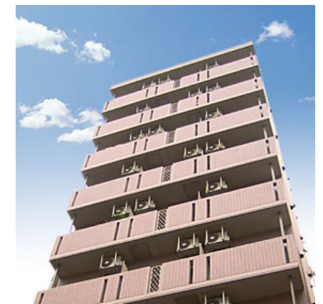
プチグランデ八丁堀 外観

※図面と現況が異なる場合は現況を優先とします。 ※写真の製品とは異なる場合があります。 ※インターネット・有料チャンネルのご利用には、別途各会社との契約が必要です。 ※個人契約の際は家賃保証会社のご契約が必要となります。