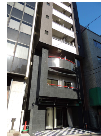
プチグランデ秋葉原外観

※図面と現況が異なる場合は現況を優先とします。 ※インターネット・有料チャンネルのご利用には、別途各会社との契約が必要です。 ※個人契約の際は家賃保証会社のご契約が必要となります。